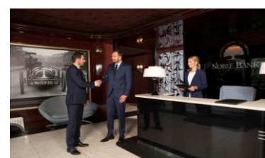
Nowy segment Bankowość Osobista Noble